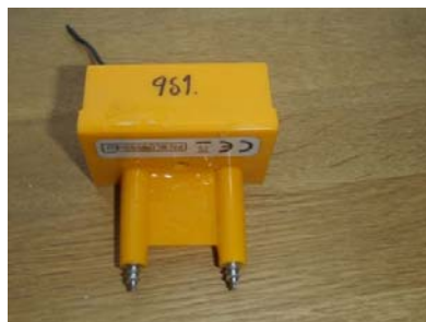
En metod för uppföljning av utförda åtgärder är inmonterade givare

De få uppföljningar som har utförts indikerar på att utförda åtgärder inte varit tillräckliga.