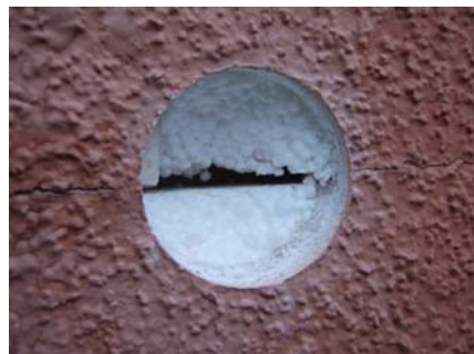
Misslyckad delreparation, otätt mellan ny och gammal fasad

De åtgärder som har utförts på dessa byggnader har varierat mellan lokala delreparationer till total friläggning och återställning med främst enstegstätade lösningar.