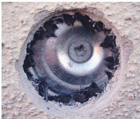
Bild 4: Utborrning av putsen vid en "vit prick". En metall kramla syns bakom putsen.

Vid undersökningar bakom dessa vita prickar fann vi metallkramlor som gick genom isoleringen och in i betongväggen bakom, bild 4. Orsaken till detta mönster med vita prickar är att kramlorna fungerar som köldbryggor, vilket medför att temperaturen i dessa punkter är högre än bredvid. Detta resulterar i sin tur i lägre fuktighet och därmed mindre risk för påväxt. Simuleringsförsök med datorprogrammet Heat3, som är ett tredimensionellt värmeledningsberäkningsprogram, gjordes för att kartlägga temperaturfördelningen vid dessa kramlor i en fasad med puts på isolering. Simuleringsförsöket genomfördes på en betongvägg med utanpåliggande puts på isolering. Beräkningarna gjordes med olika typer av kramlor (neopren och stål), olika cellplasttjocklek (50 respektive 100 mm) och olika tjocklek på puts-skiktet (5 respektive 20 mm). Simuleringen genomfördes med