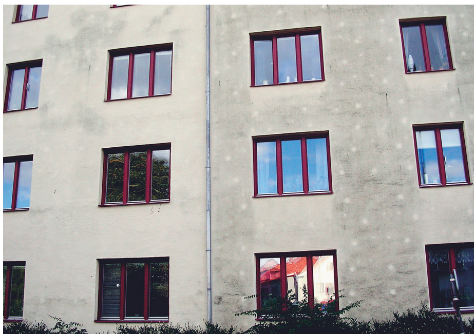
Bild 2: Fasad på byggnad i Kristianstad. Högra hälften har kraftig påväxt och vita prickar syns. Vänstra hälften har nästan ingen påväxt.

De första delresultaten från mätningar under våren visar att temperaturvariationerna i tunnputs på isolering är betydligt större än i en tegelfasad. De största dygnsvariationerna fanns i tunnputsfasaden i söderläge med röd kulör. Yttertemperaturen på fasaden varierade mellan -2\text{ }^{\circ}\text{C} och +53\text{ }^{\circ}\text{C} . Tunnputsfasaden uppvisade också den största temperaturskillnaden mellan ytan och luften. På den vita lättfasaden i söderläge var temperaturen lika låg på natten, men uppnådde bara +28\text{ }^{\circ}\text{C} på dagen. Som jämförelse blev temperaturen på tegelfasaden i söderläge maximalt +37\text{ }^{\circ}\text{C} på den röda halvan och +22\text{ }^{\circ}\text{C} på den vita halvan. När yttertemperaturen är lägre än lufttemperaturen, vilket främst inträffar under nattetid, blir den relativa fuktigheten i fasadytan hög. Detta kan medföra kondens på fasadytan och risken för biologisk påväxt är då mycket stor. Vid senare tillfällen, under hösten, har